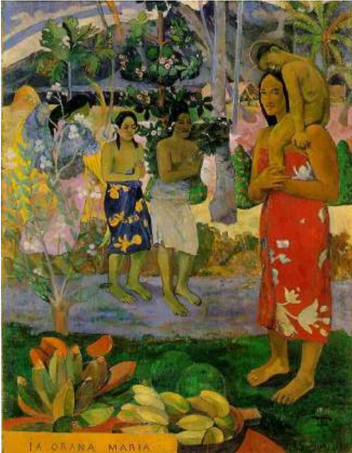
„Ia Orana Maria (Zdravo Marija)“