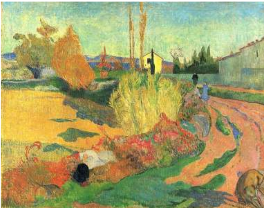
„ Pejzaž iz Arla“