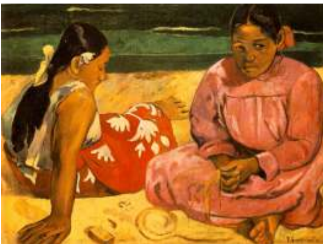
„Tahićanke na Plaži“